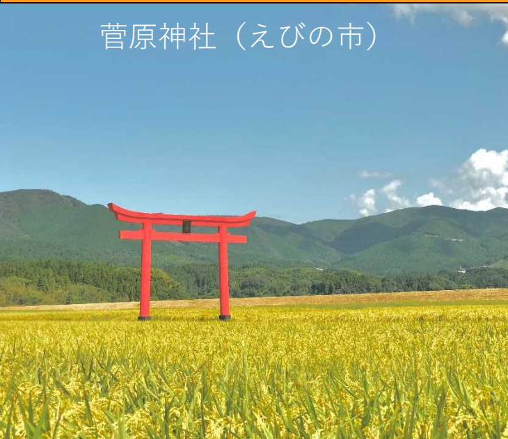
菅原神社 (えびの市)