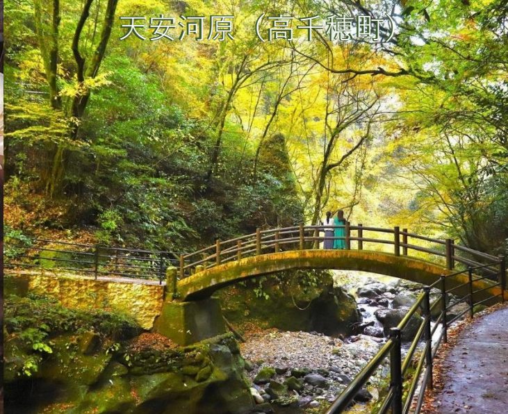
天安河原 (高千穂町)