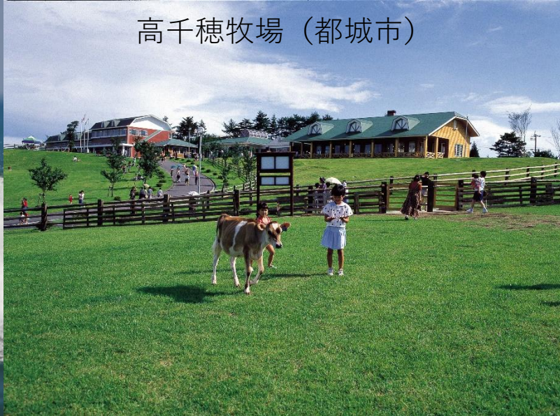
高千穂牧場（都城市）