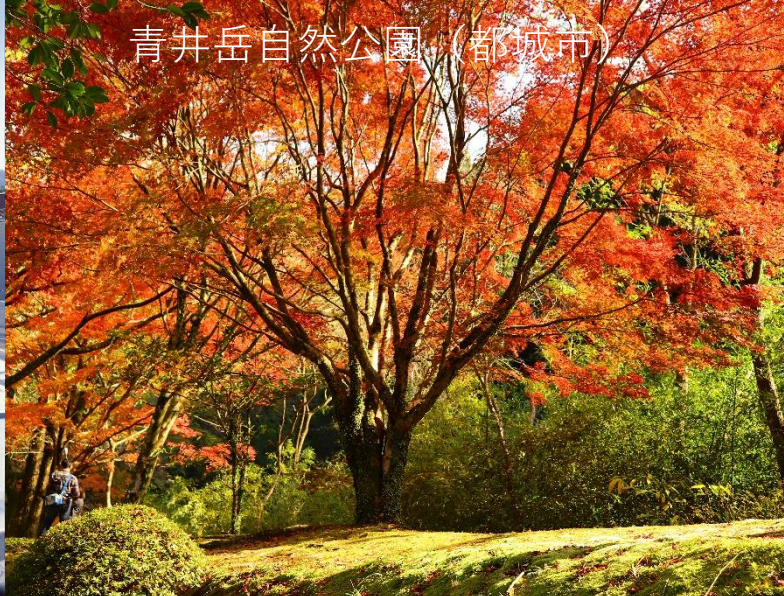
青井岳自然公園（都城市）