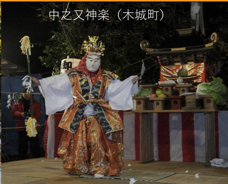
中之又神楽（木城町）