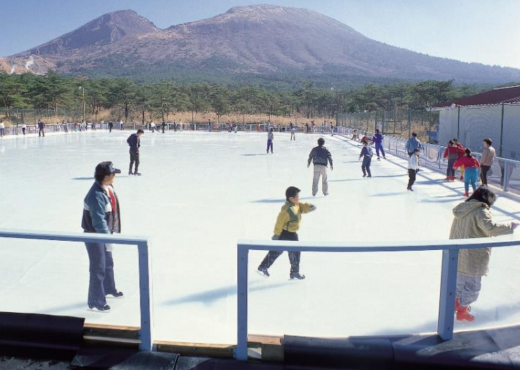
アイススケート場（えびの市）