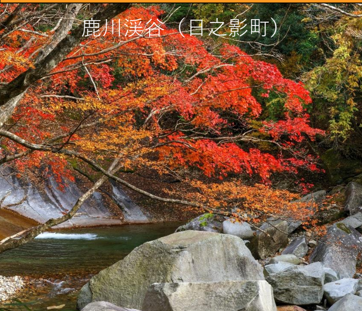
鹿川溪谷（日之影町）